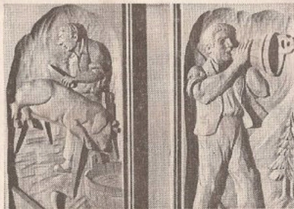
« On fait boucherie » et « Appel sur l'Alpe ».